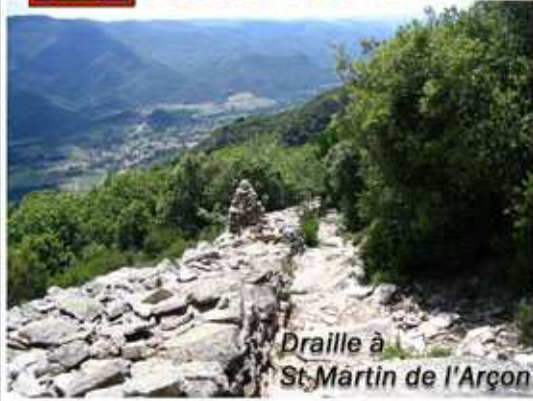
Draille à St-Martin de l'Arçon