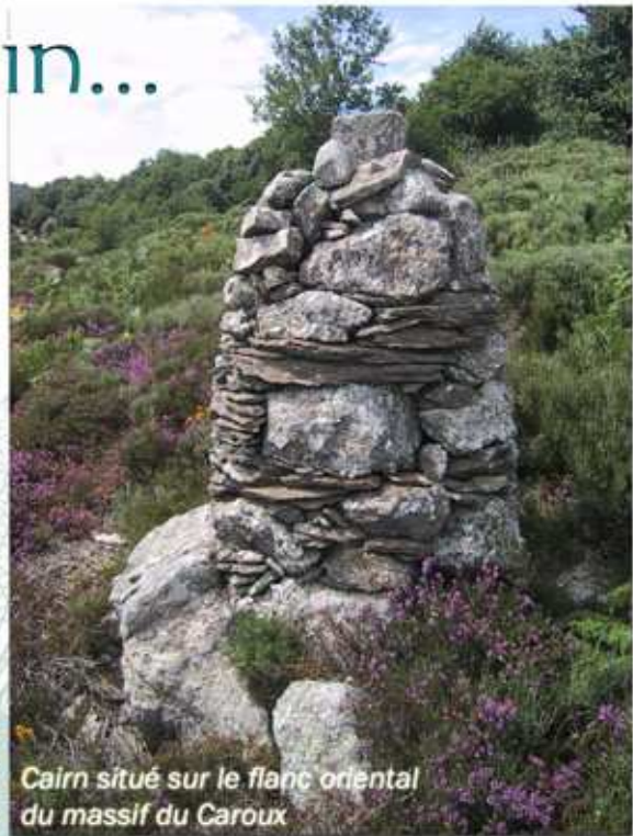
Cairn situé sur le flanc oriental du massif du Caroux

Laissez-vous entraîner par les échos du passé et partez à la découverte d'un patrimoine historique et naturel d'une exceptionnelle beauté. Qui sait peut-être, au détour d'un chemin, une rencontre inattendue vous attend !