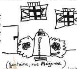
Elèves de CM1-CM2, Ecole d'Olargues.