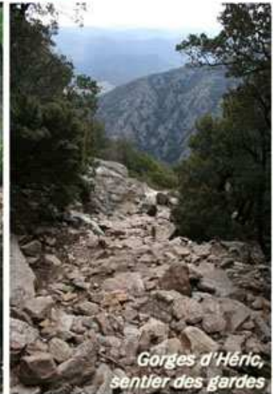
Gorges d'Héric, sentier des gardes

activités de randonnées, de loisirs, de chasse et grâce à des passionnés d'histoire et de nature qui sont prêts à retrousser les manches pour dégager les bribes d'un passé à ne pas oublier. Les agriculteurs, castanéiculteurs ou viticulteurs, de par leur activité, œuvrent, aussi, à restaurer ce patrimoine ancestral. Il existe, à l'heure actuelle, 2600 kilomètres d'itinéraires décrits et balisés, empruntant pour la plupart d'anciens chemins, sur le territoire du Pays Haut-Languedoc & Vignobles.