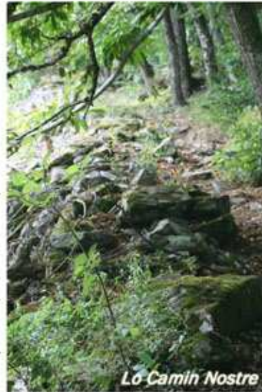
Lo Camih Nostre

Heureusement, à ce jour, ces chemins retrouvent une nouvelle vocation grâce aux