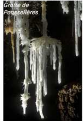
Gratte de Pousselières